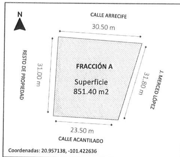
Figura 1. Propuesta de terreno SAPAS