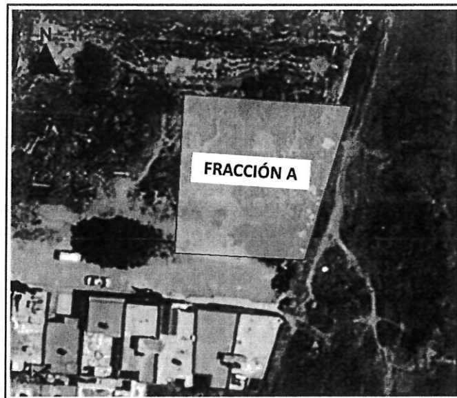
Figura 2. Vista aérea del predio

SEGUNDO. Se ponga a consideración del pleno del H. Ayuntamiento, por tratarse de un BIEN INMUEBLE DE DOMINIO PÚBLICO y de acuerdo con el fundamento legal expuesto en el PUNTO QUINTO de CONSIDERANDOS previo a la autorización de la donación, se autorice la desafectación del dominio público del predio descrito en el PUNTO SEGUNDO de ANTECEDENTES.