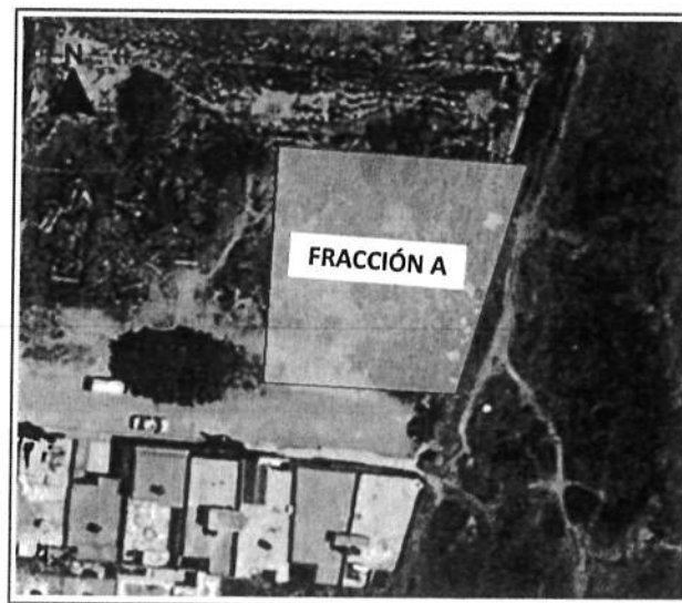
Figura 2. Vista aérea del predio

Esta hoja forma parte del Dictamen NO. DGDUEOT/005/15/NOVIEMBRE/2023, correspondiente a donación de predio a favor del Sistema de Agua Potable y Alcantarillado de Silao para Proyecto para Construcción de Carcamo de Bombeo en Fraccionamiento El Faro II, del Municipio de Silao de la Victoria, Guanajuato, de fecha 15 de noviembre de 2023, que consta de 10 hojas útiles.